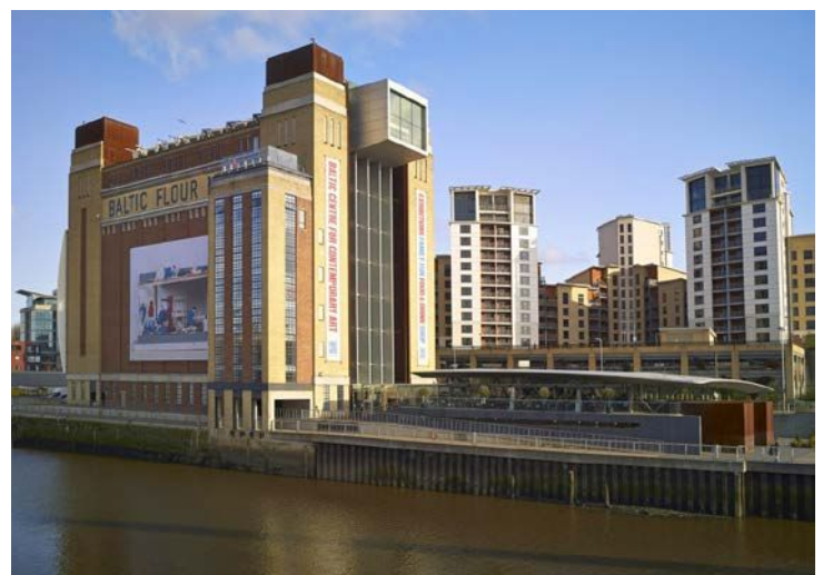
Baltic Centre for Contemporary Art, à Gateshead.