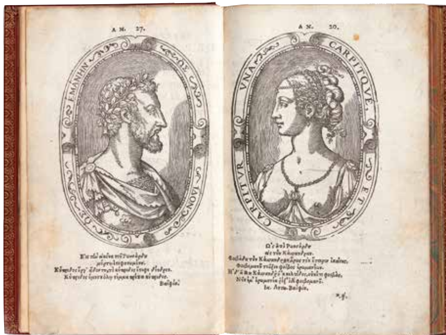
Pierre de Ronsard, Les Amours... nouvellement augme[n]tées par lui, & commentées par Marc-Antoine de Muret, Paris, 1553, deux ouvrages en un volume in-8. Portraits gravés sur bois, légendés en grec, de Ronsard et Cassandre Salviati. Reliure de Trautz-Bauzonnet. Estimation : 40 000-60 000 €.